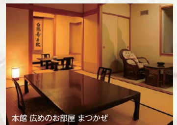
本館 広めのお部屋 まつかぜ

男鹿・秋田の旬の食材にこだわった和風創作料理をお楽しみいただけます。お客様が選んだ地元の食材をオープンキッチンスタイルの炭火焼きグリルで焼き上げてお出ししています