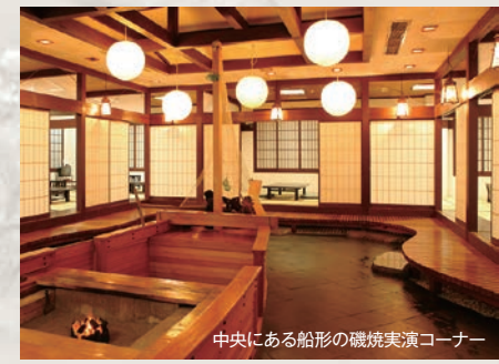
中央にある船形の磯焼実演コーナー