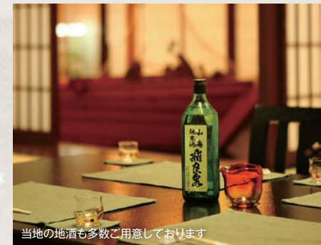
当地の地酒も多数ご用意しております