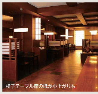
椅子テーブル席のほか小上がりも